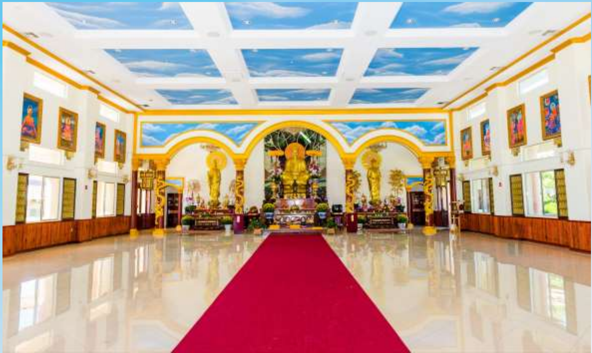
THIÊN VIỆN CHÂN NGUYÊN, ADELANTO, CA